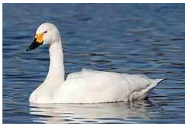
Labuť spevavá ( lat. Cygnus cygnus )

Labuť hrbozobá alebo staršie labuť veľká ( lat. Cygnus olor )