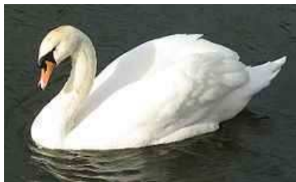
Labuť tundrová alebo labuť malá ( Cygnus bewickii )