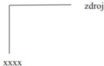
Obrázok 3: Schéma kódovania zdrojov